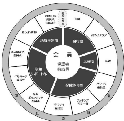
PTA組織図(『全員参加型の5部制』)

我が校のPTA活動は、岐阜市の中でもめずらしく毎年全員参加のPTA活動を行っている学校です。この制度は、平成12年度に導入され、今年で16年目を迎えました。当時のPTA役員の方たちが、「本来のPTAとはなんだろう。やらされているというような消極的な委員会活動でいいのだろうか。今の親の姿を見て子供たちの心が健全に育つのだろうか。」という疑問を拾い上げて、「会員が主体的に参加する方法を見つけていこうではないか。」という考えに行きつきました。全員の考えを大切に、全会員が自分の活動しやすい委員会を提案し、そして自らで選択できるPTA活動にしたのです。こうして「サークル型の組織図」ができあがりました。